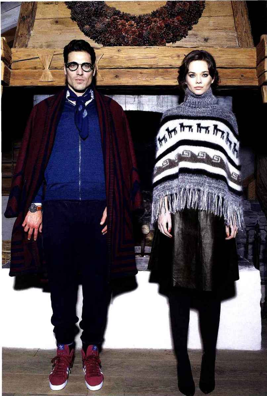
LUI : MANTEAU, PANTALON ET CHAUSSETTES, LOUIS VUITTON. GILET, DIOR HOMME. CHEMISE, LA COMÉDIE HUMAINE. FOULARD, HERMÈS. BASKETS, ADIDAS. LUNETTES, HARDY AMIES CHEZ JLC OPTICIEN. MONTRE, BELL & ROSS. ELLE : CAPE, JOSEPH. JUPE, BALLY. COLLANTS, FALKE. ESCARPINS, MINELLI. BRACELET, DINH VAN.