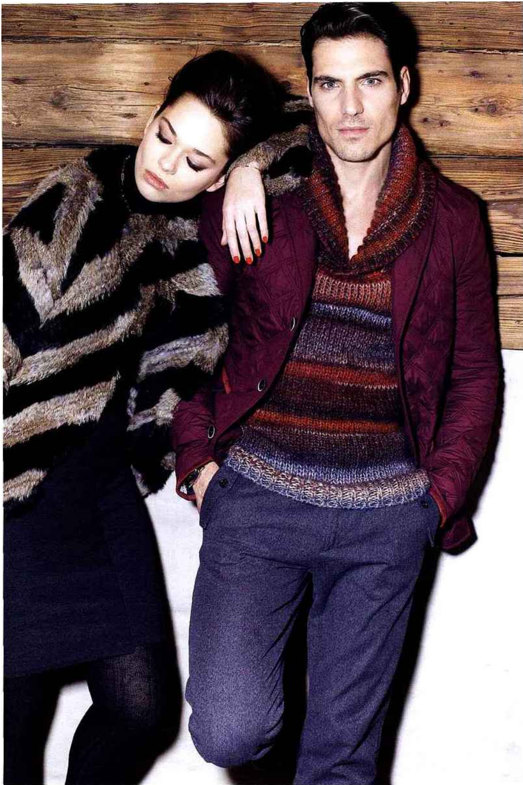
ELLE : BLOUSON EN FOURRURE, ZADIG & VOLTAIRE . ROBE ET PULL, RALPH LAUREN . COLLIER, DINH VAN . LUI : VESTE, HUGO BOSS . PANTALON, LOUIS VUITTON . PULL, ZADIG & VOLTAIRE . MONTRE, PANERAI . Remerciements aux équipes du Chalet Zannier, à Megève, pour leur accueil.