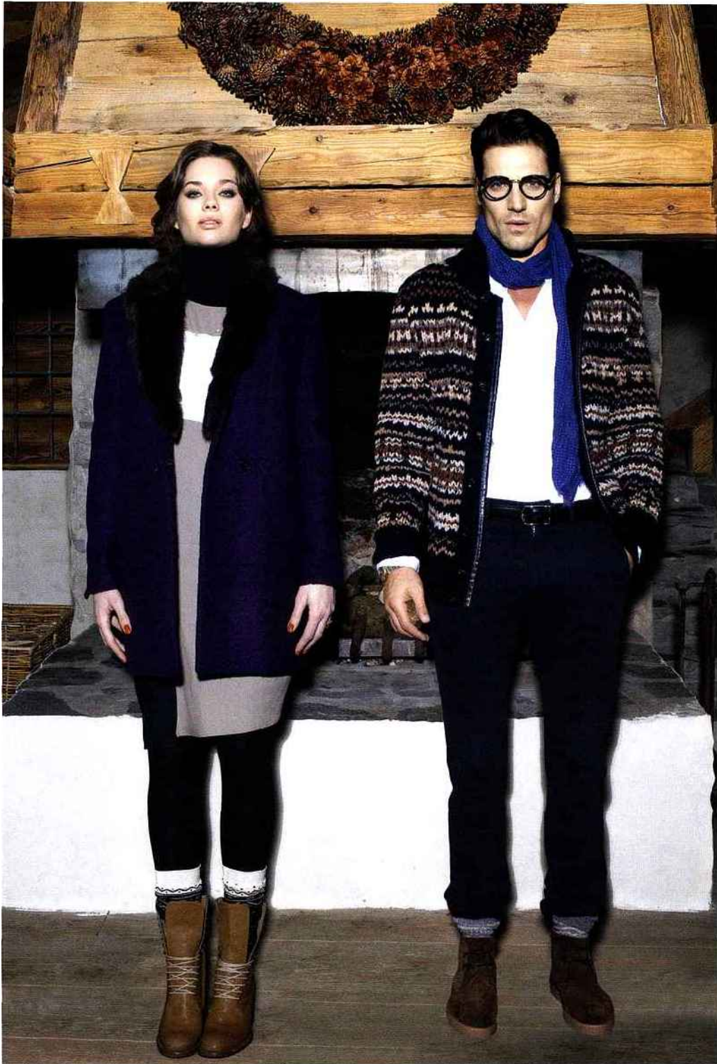
ELLE : MANTEAU, THE KOOPLES. ROBE, IKKS. BOOTS, FREE LANCE. BAGUE, CARTIER. LUI : PULL ET PANTALON, ERMENEGILDO ZEGNA. CHEMISE, PAUL & JOE. FOULARD, IKKS. CEINTURE, JOHN LOBB. CHAUSSETTES, FALKE. LUNETTES, HARDY AMIES CHEZ JLC OPTICIEN. MONTRE, ROLEX.