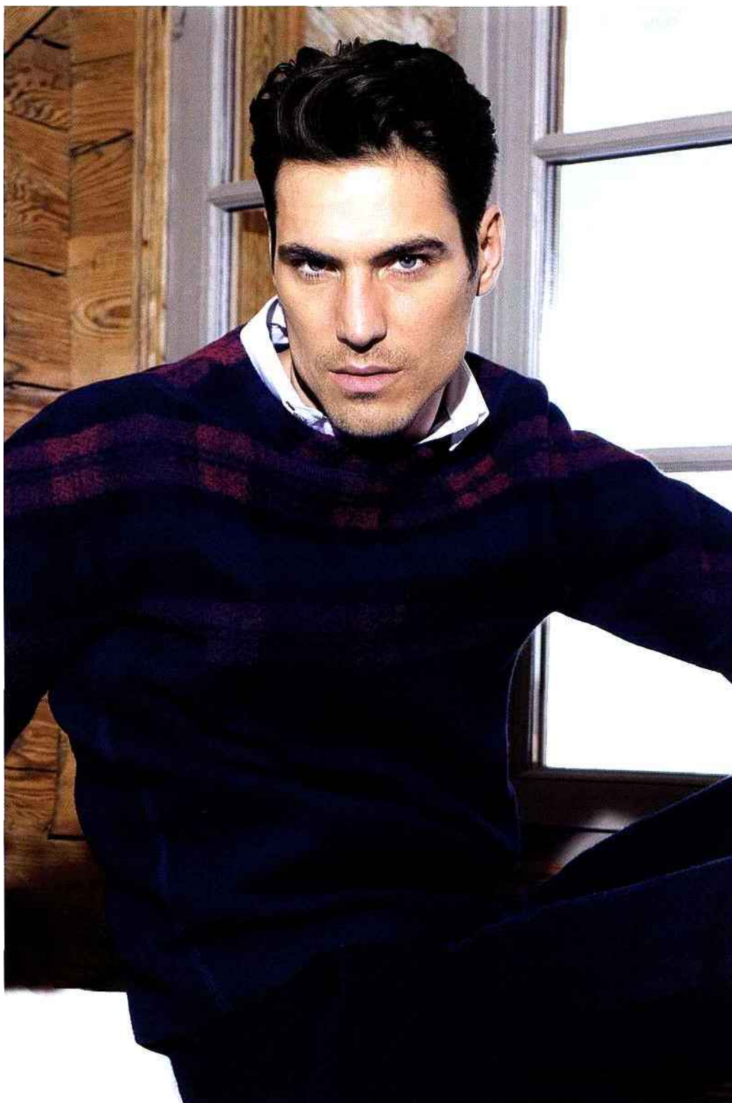
LUI : PULL ET PANTALON, LANVIN. CHEMISE, LA COMÉDIE HUMAINE.