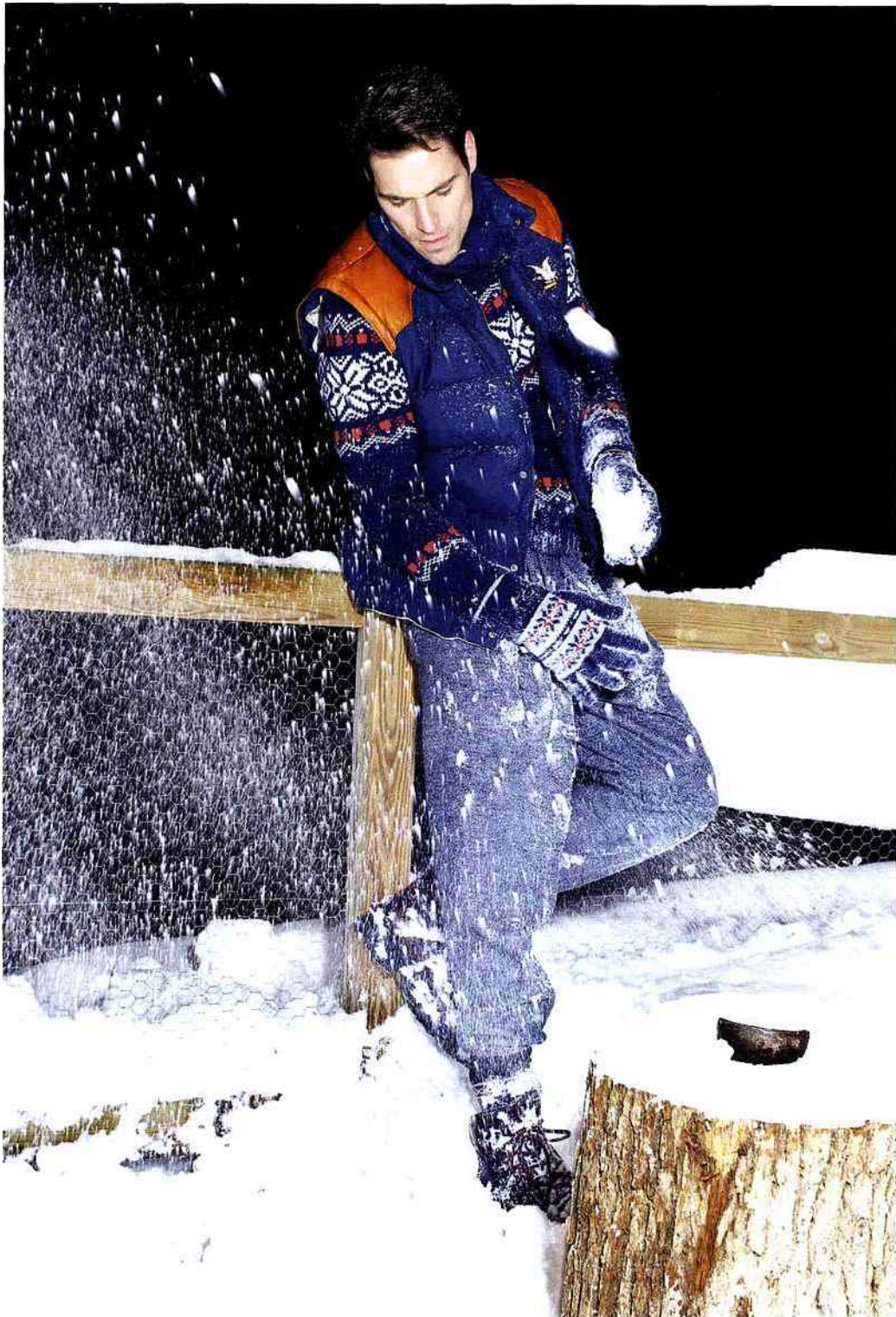
LUI : DOUDOUNE, CHEVIGNON. PULL, GANT RUGGER. PANTALON, GIORGIO ARMANI. BOOTS, TOD'S. CHAUSSETTES, FALKE. GANTS, TOMMY HILFIGER. FOULARD, HERMÈS.